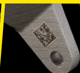
2D kód Datamatrix